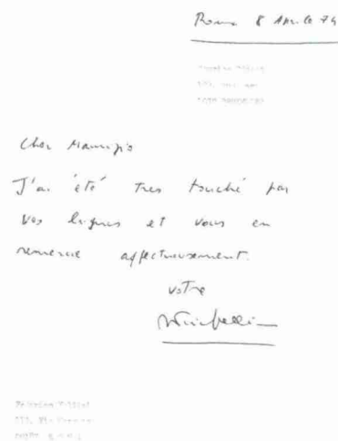
TRÉSORS Le Fonds Béjart contient des photos rares et inédites de Maurice Béjart et des lettres de ses nombreux correspondants comme, ici, le cinéaste Federico Fellini.